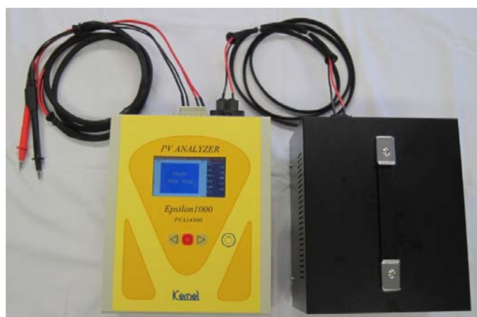
PV アナライザイプシロンとの接続方法

※本器を使用するにはPVアナライザの改造が必要です。 既に機器をお持ちの場合は いったん弊社へご返送いただき、改造いたします。 費用と期間に関してはお問い合わせください。