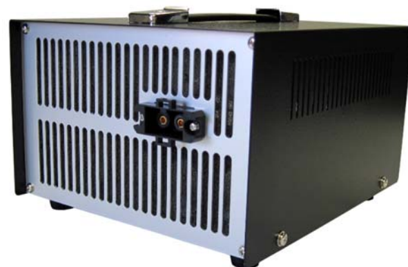
ユニット単体外観(前面)